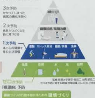
【予防医学の4つのレベル】

空気や明るさ、温度といった住まいの環境を整え、快適にすることは、健康にもつながります！ 予防医学には4つのレベルがあり、入浴習慣、家族団らんを含む生活習慣は1次予防、温度や空気を快適に保つ環境づくりはゼロ次予防となります。